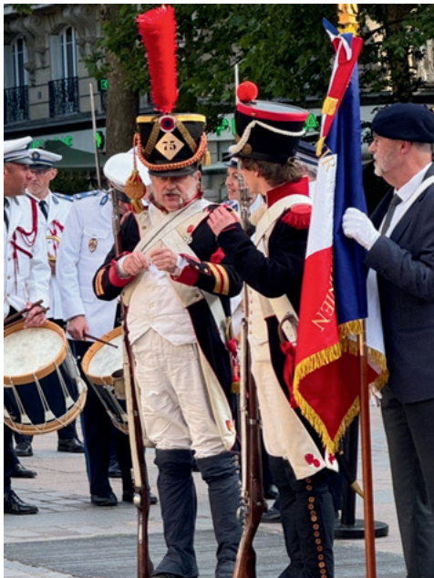
La garde impériale, ici entre la musique de la préfecture de police et les porte-drapeaux, est venue apporter son concours à cette manifestation qui fut suivie, à la mairie, d'un « Bal Liberty » où nombreux, femmes et hommes, étaient ceux qui avaient revêtu pour l'occasion des costumes du temps de la Libération.