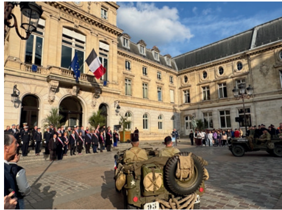
Devant la mairie : au premier plan, une ancienne Jeep de l'armée américaine, à gauche, sur le parvis, les élus et les autorités, à droite les enfants de l'école Brancion qui ont interprété la Marseillaise et des chants patriotiques.