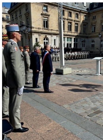
Le Nid d'Aigle d'Hitler à Berchtesgaden a été pris le 4 mai 1945 par le 501 ème régiment de chars de combat de l'armée française

Directeur de la publication : Patrice Tromparent