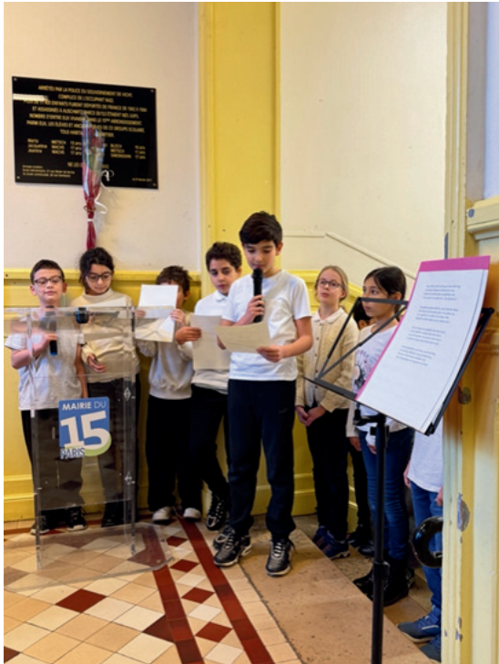
Sous la plaque du souvenir.