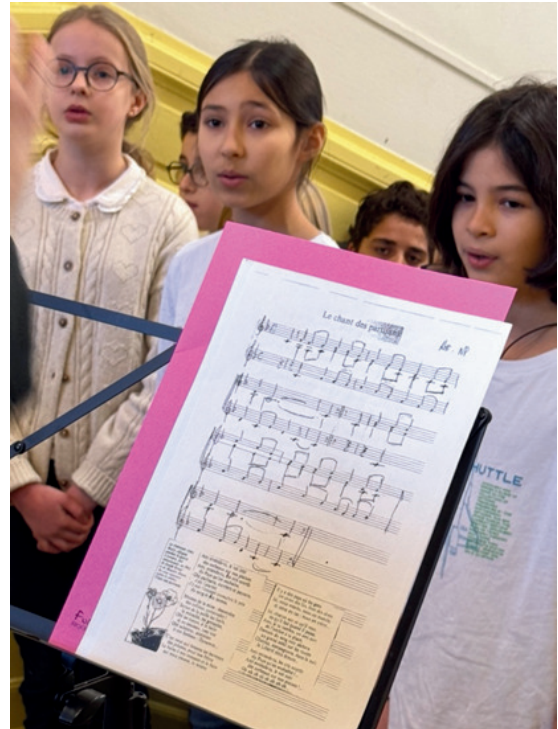
Trois jeunes élèves interprètent le Chant des Partisans.