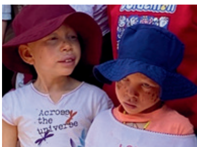
1 - Enfants albinos au Burundi

Un très beau livre, Les enfants invisibles, histoires d'enfants des rues , écrit avec Olivier Villepreux, illustré par Guillaume Reynaud (Actes Sud, 2012), rapporte les témoignages poignants de ces enfants auxquels elle vient en aide.