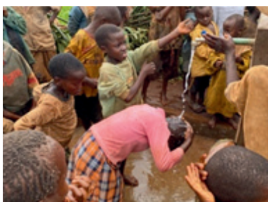
2 - Puits pour les Batwas